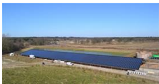
Zonneweide Anna's Hoeve

HilverZon heeft in 2018 drie zonnedaken opgeleverd. Zonneweide Anna's Hoeve werd in maart feestelijk geopend, Zonnedak Dudok Arena I in april en Dudok Arena II in september. Via deze projecten nemen zo'n 230 huishoudens in Hilversum via HilverZon|om groene stroom af van een collectief lokaal zonnedak. In totaal zijn er nu 350 huishoudens die deelnemen aan een van de 6 zonnedaken van HilverZon.