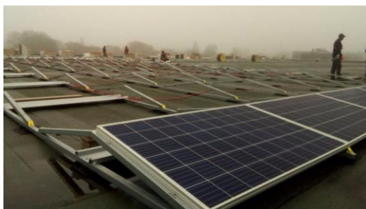
Aanleg eerste zonnepanelen HilverZonnedak Dudok Arena fase 1

De 772 panelen op Dudok Arena fase 1, waren al eind 2017 gelegd. De kabels van de zonnepanelen op het dak naar de 'meterkast' zijn in een gezamenlijke inspanning van Solar Partners en een aantal HilverZonners gelegd. Aan dit zonnedak nemen 60 Hilversumse huishoudens deel. De inwerkingtreding liep helaas vertraging op, en ging op 1 juli van start. Dit als gevolg van een tussentijds aangepast plan van aanpak door Liander, de netwerkbeheerder waarvan we afhankelijk zijn voor de aansluiting op het net.