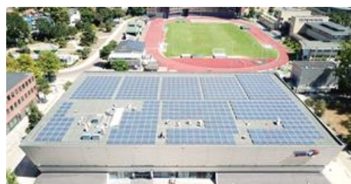
Dudok Arena 1 en 2