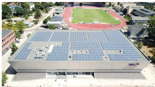
HilverZonnepanelen Dak Dudok Arena I en II

De eerste fase is op 1 april 2018 gestart als postcoderoos. De tweede fase met 528 panelen is in mei gelegd en op 1 juli als postcoderoos gestart. In de tweede helft van het jaar hebben we een aanbesteding gehouden voor het wassen van onze panelen. De keuze is gevallen op Flevo Solar Wash, een bedrijf dat zich gespecialiseerd heeft in het reinigen van panelen. Met het contract worden alle panelen een maal per jaar gereinigd en wordt tevens een visuele controle op het zonnepanelendak uitgevoerd.