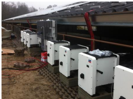
Omvormers Zonneweide Anna's Hoeve

In het project werkte HilverZon nauw samen met de gemeente en bij de opening (maart 2018) is dit het Nederlands grootste Postcoderoosproject.]