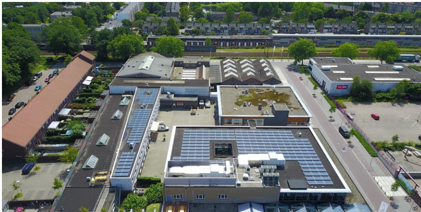
Rotor Media Gebouw

Het eerste dak waarop we in 2017 zonnepanelen hebben gerealiseerd was geen gemeentedak, maar het dak van het Rotor Media gebouw in de Arendstraat.