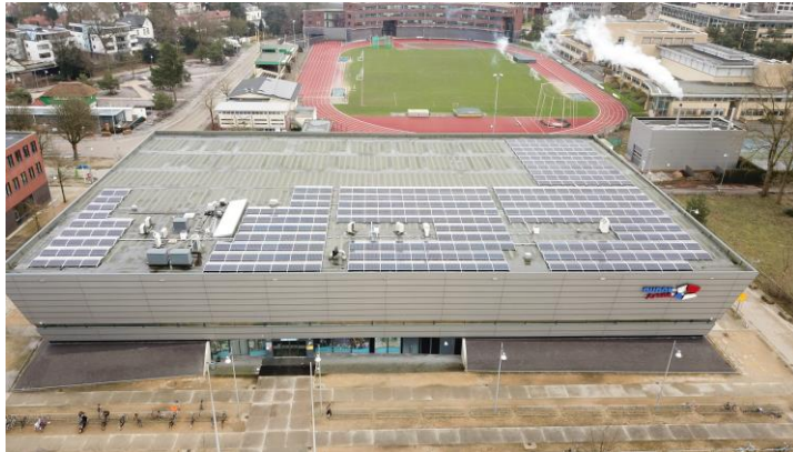
Sporthal Dudok Arena

In december zijn 728 zonnepanelen op Sporthal Dudok Arena gelegd. Aan dit zonnedak - beter bekend als Dudok Arena fase 1 - nemen 60 Hilversumse huishoudens deel. De inwerkingtreding liep helaas vertraging op. Dit als gevolg van een tussentijds aangepast plan van aanpak door Liander, de netwerkbeheerder waarvan we afhankelijk zijn voor de aansluiting op het net. Bij het ter perse gaan van dit jaarverslag is het project volledig up & running en profiteren deelnemers dagelijks van lokaal opgewekte zonnestroom.